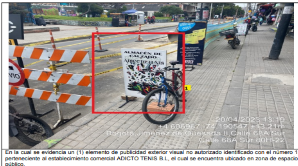
En la cual se evidencia un (1) elemento de publicidad exterior visual no autorizado identificado con el número 1 perteneciente al establecimiento comercial ADICTO TENIS B.L, el cual se encuentra ubicado en zona de espacio público.